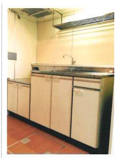
— 台所 —