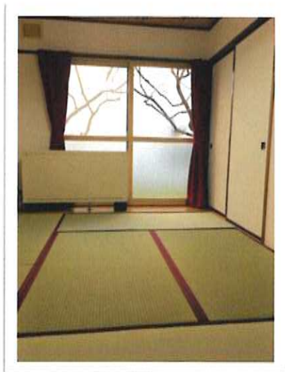
— 単身部屋 —