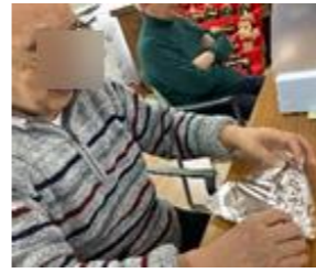
皆さんとサツマ芋のお汁粉を作りました。