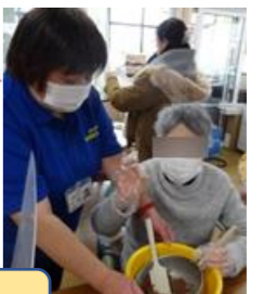
バレンタインデーと重なり、 チョコレートも作りました。