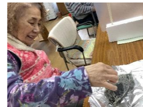
サツマ芋をアルミホ イルで包んだよ。