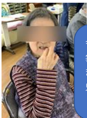
今年は落花生ではなく、 袋の甘納豆で鬼退治をし ました。 鬼退治後、皆さんとおい しくいただきました。