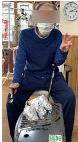
アルミホイルにくるんだサツマ芋を、ストーブの上で焼き芋にして、芋が 柔らかくなったら、小さく切って、汁粉の中に入れて、出来上がり〜。