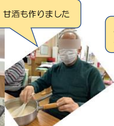
甘酒も作りました