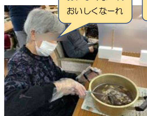
おいしくなーれ おいしくなーれ