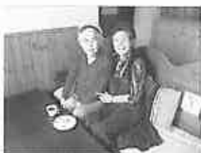
「教会員の方と一緒に・・・」

四月十一日、今年も隣の羊ヶ丘教会で「喫茶ホザンナ」が始まりました。「喫茶ホザンナ」は、毎週木曜日十時にオープンし、コーヒー、ココア、紅茶の他、何種類もの手作りケーキを用意していただきます。