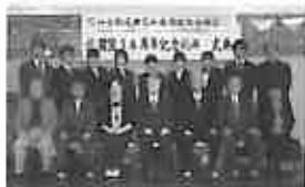
「新職員の記念撮影」