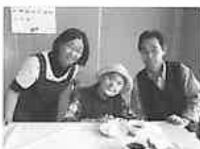
「ご家族とともに記念撮影」

例年がない大雪と寒さで、四月中は隣の喫茶を利用できませんでした。五月に入りようやく訪ねることができました。久しぶりに外の空気に触れた時には、皆様笑顔で、多く大変満足のご様子でした。今年も、短い北海道の夏を満喫していきたいと思えます。