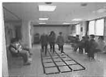
難しいけど頑張っ！

四月十七日に第一回目の「ふまねっと」を開催しました。歩行機能の改善や注意力・記憶力・集中力の向上が期待できる等の効果を説明した後、いよいよステップの開始です。「はじめの一步」というウォーミングアップを行ったところ、参加者全員がスムーズなステップを踏まれました。他のステップで、気持ちが焦り躓きそうになったご利用者もおられました。初回にも関わらず、基本のステップ4つをこなし、応用ステップも1つ行うことが出来ました。応用ステップは「もしもしかめさん」の童謡に合わせてステップを踏むので、見ている方々が歌い、参加者全員が和気あいあいと楽しまれています。「難しかったね。でも楽しかったね。」「楽しかったよ。頭の体操にもなるわ。」等の声が聞かれ、「楽しみながら健康になれる」の一步を踏み出すことが出来ました。