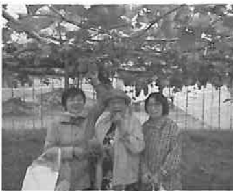
美味しいぶどうでした