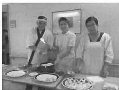
〜新米おにぎりを皆様の前で握りました〜

十月二十六日（金）の昼食は、皆様が楽しみにしていた「新米おにぎり」の日でした。食堂では、店長が心をこめておにぎりを握り、皆様に食べていただきました。手についたご飯粒を口にしながら、美味しそうに召し上がられる方、また昔を思い起こしながら召し上がられる方もいらつしやり、大満足の様子でした。