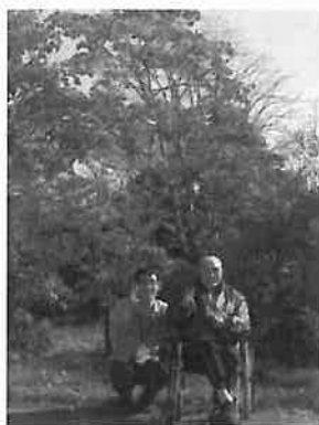
〜車から降りて記念撮影〜