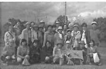
ぶどう園で全員集合!

また、観光農園より採れたてのミニトマトを沢山頂きました。とても甘くて美味しいトマトで、皆様にとっては思いもかけないプレゼントになりました。御心