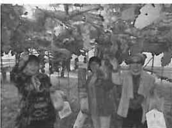
立派なぶどうにすぐ手が届きます

造りに感謝し、従業員の皆様に手を振りながら観光農園をあとにしました。 ぶどう狩りを十分に堪能した後は、余市町の鶴亀温泉へ向かい、昼食はお刺身・てんぷら・焼き物・煮物などを盛り合わせたお弁当でした。味も好評でおしゃべりを楽しみながら美味しく頂きました。