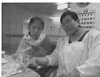
「新米は、おいしいね〜」