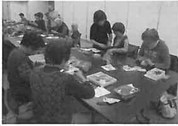
10月26日開催 すこやか倶楽部