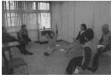
10月30日開催 転倒予防教室