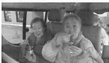
「寒いけど、アイスクリームは美味しいな〜」

山も、秋の色づきはじめて十月下旬頃、恒例となった秋のドライブ「もみじ狩り」に、沢山の方が参加することができました。今年は、あっという間に寒さが厳しくなり、いつもの綺麗な色づきは見られませんでした。少しだけ外気に触れることができました。帰りは、マクドナルドでちよつと寄り道をし、アイスクリームを召し上がりました。楽しみに